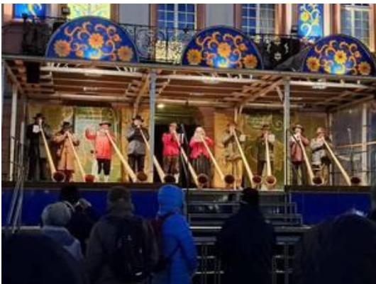
Rathaus Gengenbach - Alphornfreunde Mittlerer Schwarzwald