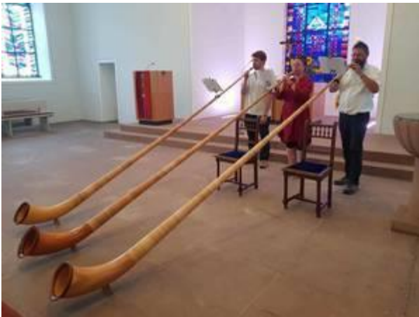
Alphorngruppe "Herzklang"