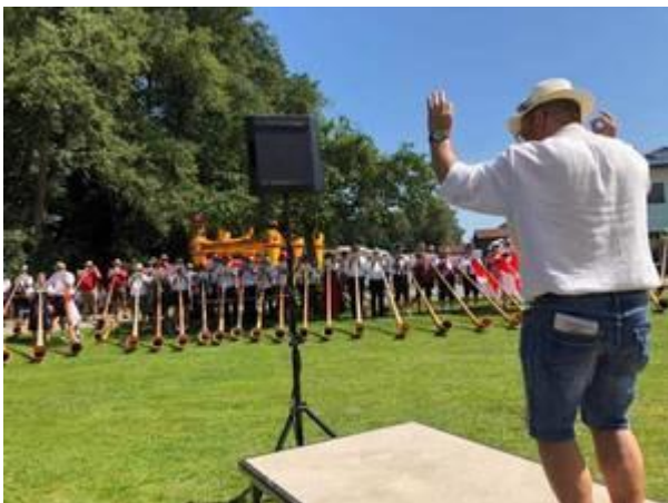
Alphornbläsertreffen - Alphornverband Baden-Württemberg