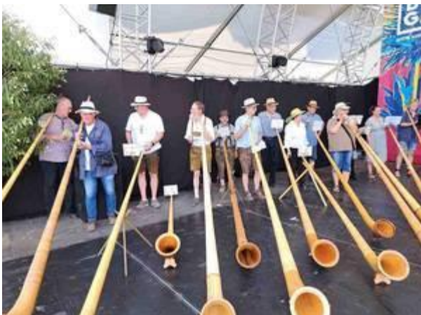
Alphornbläser auf der BUGA Mannheim