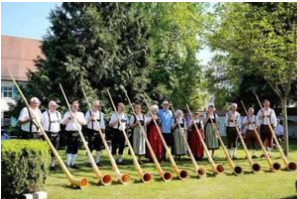
Gruppenbild der Teilnehmenden am Jubiläumskonzert