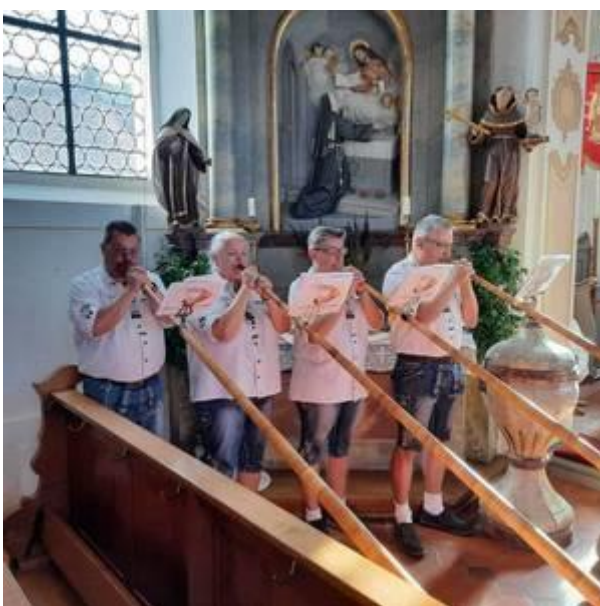
Alphornbläsertreffen - Alphornverband Baden-Württemberg