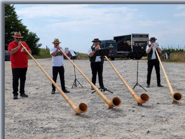
Vier Mitglieder des ABW spielten gemeinsam zwei Alphorntitel.