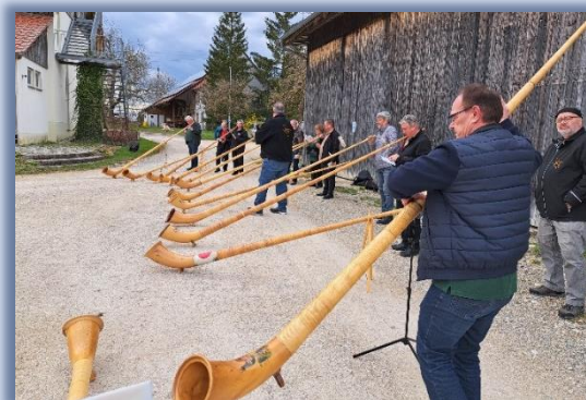
Bilder unten: Stefan Studerus