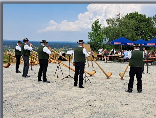
Text und Bilder: Stefan Studerus

https://www.youtube.com/watch?v=KDYJ9wJLg3Q